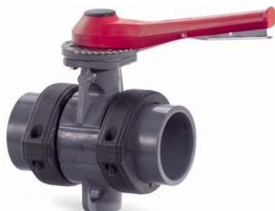
Uzavírací klapka d63-225