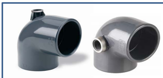
Koleno "AIR" d50-200 d50-75