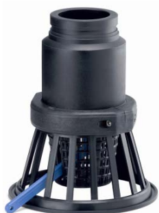
Zpětná klapka se sacím košem a patkou dvířková d90-200