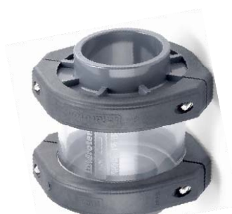
Zpětná klapka transparentní dvířková d40-200