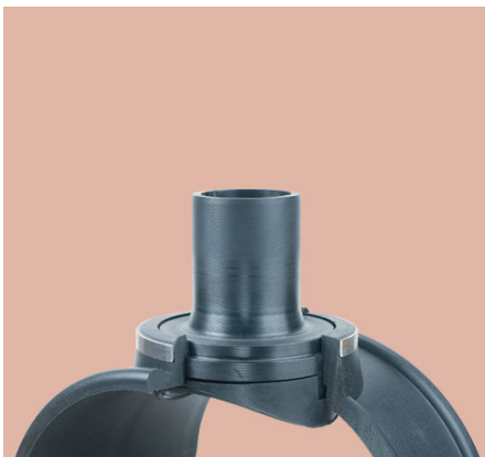
PP navrtávací odbočka s pantem závitové ústí M PVC s kovovým kroužkem